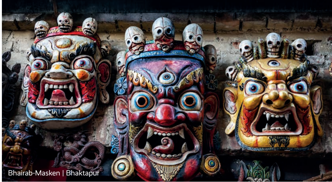
Bhairab-Masken | Bhaktapur