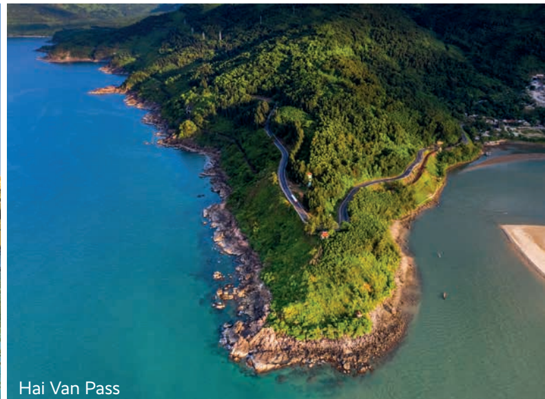
Hai Van Pass

VERANSTALTER: REISEWELT GMBH, A-4020 LINZ, EUROPAPLATZ 1A, Tel.: +43 732 6596 26001, office@reisewelt.at Nähere Details zur Reisewelt GmbH können mittels GISA Abfrage ( www.gisa.gv.at/abfrage ) in Erfahrung gebracht werden: GISA-Zahl 14955723 Gemäß der Pauschalreiseverordnung (PRV) sind Kundengelder bei Pauschalreisen und verbundenen Reiseleistungen der Reisewelt GmbH unter folgenden Voraussetzungen abgesichert: