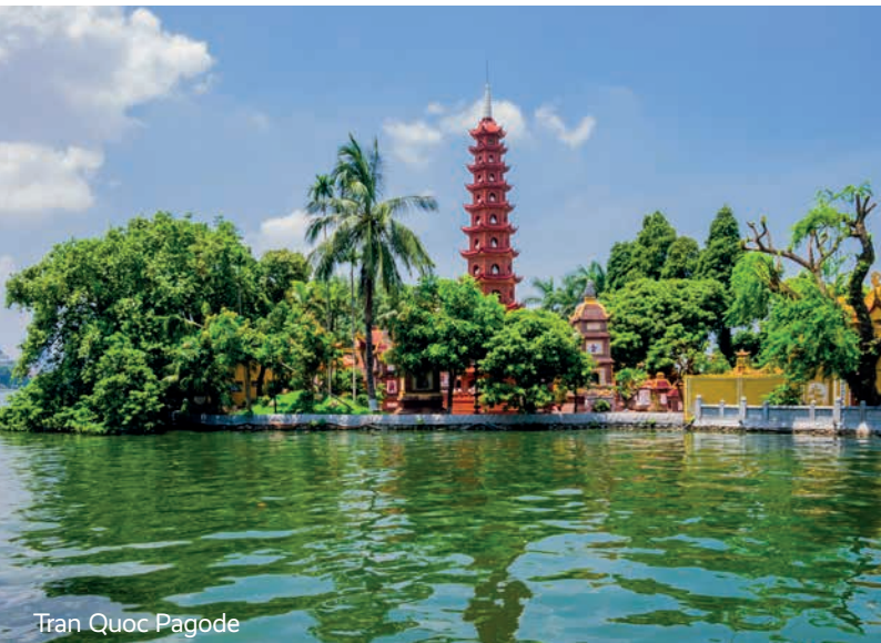
Tran Quoc Pagode