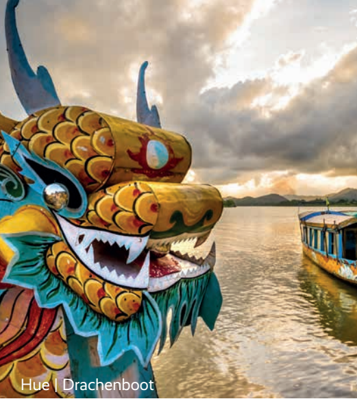
Hue | Drachenboot