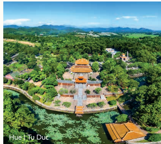
Hue | Tu Duc